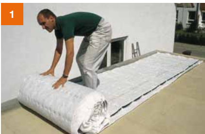
SDF-Matte auf der wurzelfesten Abdichtung ausrollen ...