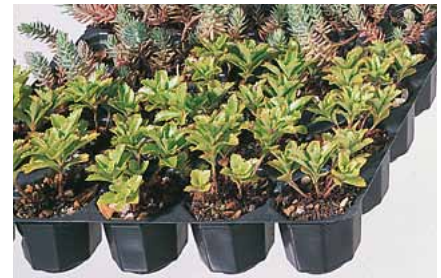
Gutschein für 220 Flachballenstauden und Startdünger