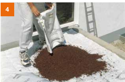
Unmittelbar im Anschluss pro Quadratmeter zwei Sack Pflanzerde einbauen. Bauder SDF-Matte nicht ohne Auflast liegen lassen.