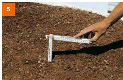
Auf eine gleichmäßige Einbauhöhe der Pflanzerde von ca. 8 cm achten.