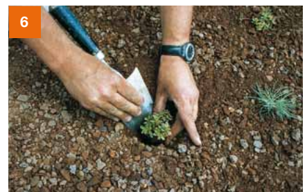
Flachballenstauden einsetzen und leicht andrücken. Der Pflanzenballen muss leicht mit Substrat bedeckt sein. Anschließend wässern und düngen.