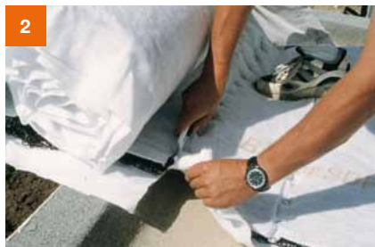
... zurechtschneiden und vollflächig, stumpf gestoßen verlegen. Überlappung der Längsnähte schließen.