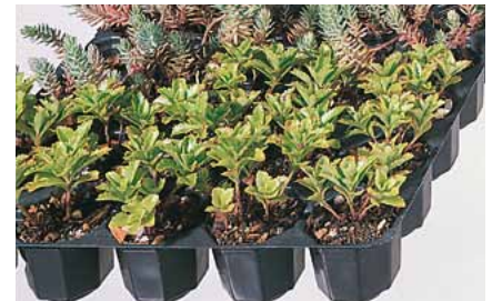
Gutschein für 120 Flachballenstauden und Startdünger

Voraussetzung: Durchwurzelungsfeste Dachabdichtung