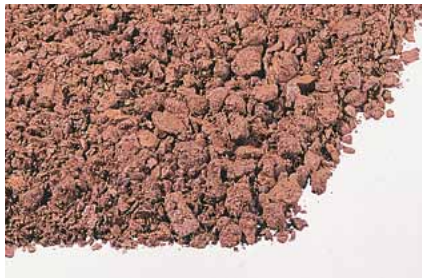
23 Sack Pflanzerde