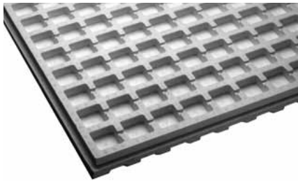
20 Wasserspeicherplatten 1) und 25 m 2 Filtervlies