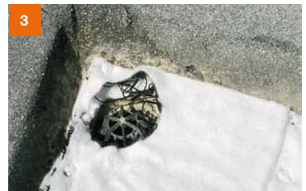
Im Bereich von Dachabläufen SDF-Matte ausschneiden. Kann kein Kontrollschacht aufgestellt werden, Dachablauf mit Grobkies einfassen – vgl. Checkliste.