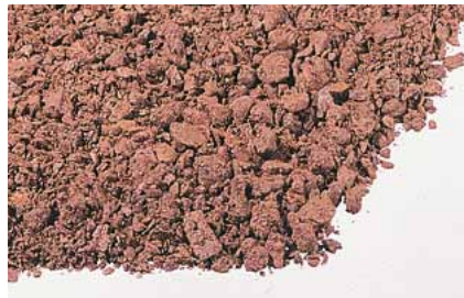
20 Sack Pflanzerde